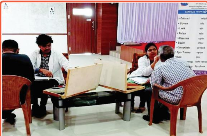
ତା ୨୧.୧.୨୩ରେ ନୀଳାଦ୍ରି ଭଙ୍ଗନିବାସ ଠାରେ ଶ୍ରୀମନ୍ଦିର ପ୍ରଶାସନ ତରଫରୁ ଆୟୋଜିତ ନିଃଶୁଳ୍କ 'ଚକ୍ଷୁ ପରୀକ୍ଷା ଶିବିର'