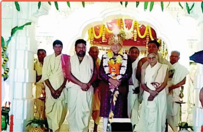
ତା ୧.୧.୨୩ରେ ପବିତ୍ର ପୁଷ୍ୟା ନକ୍ଷତ୍ର ତିଥିରେ ରାଜ ନଅରରେ ଗଜପତି ମହାରାଜା ଶ୍ରୀ ଶ୍ରୀ ଦିବ୍ୟସିଂହ ଦେବଙ୍କ ପୁଷ୍ୟାଭିଷେକ