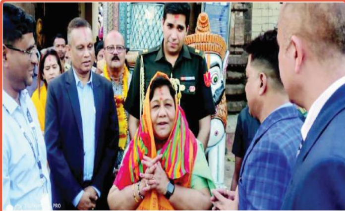
ତା ୧୦.୧.୨୩ରେ ଛତିଶଗଡ଼ର ମହାମହିମ ରାଜ୍ୟପାଳ ଅନୁସୂୟା ଉକି ଶ୍ରୀମନ୍ଦିରରେ ଶ୍ରୀଚତୁର୍ଦ୍ଧାବିଗ୍ରହଙ୍କ ଦର୍ଶନ ସାରି ଫେରୁଅଛନ୍ତି