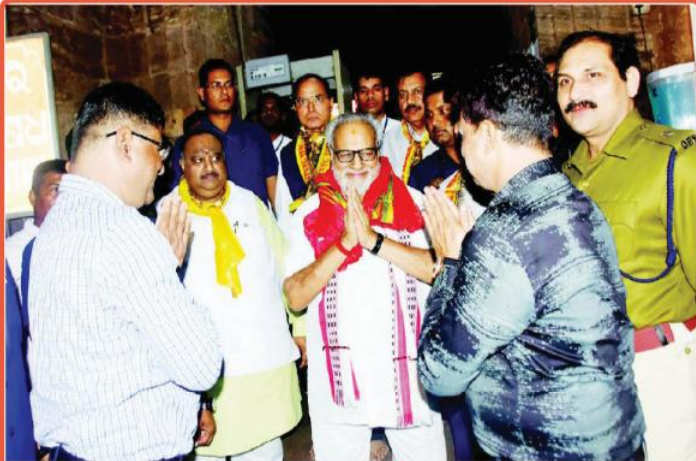
ତା ୧୧.୧.୨୩ରେ ନୂତନ ବର୍ଷ ଅବସରରେ ଓଡ଼ିଶାର ମହାମହିମ ରାଜ୍ୟପାଳ ପ୍ରଫେସର ଗଣେଶୀ ଲାଲ ଶ୍ରୀମନ୍ଦିରରୁ ଶ୍ରୀବିଗ୍ରହମାନଙ୍କ ଦର୍ଶନ ସାରି ଫେରୁଅଛନ୍ତି