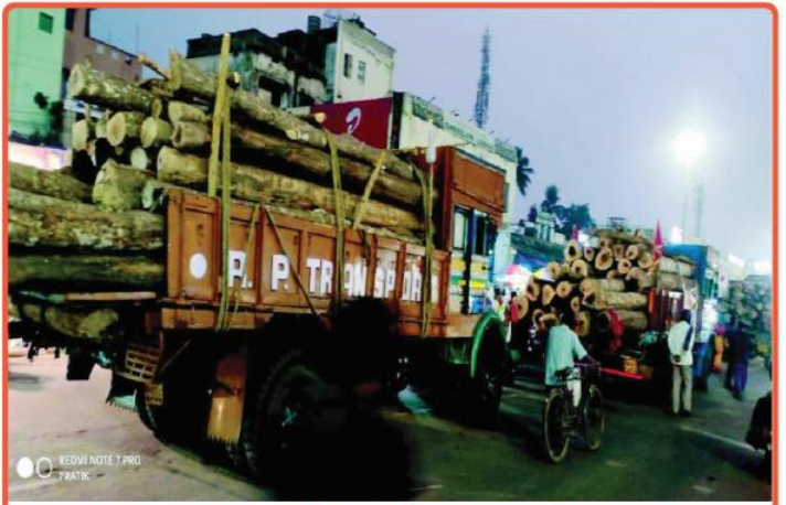
ତା ୨୧.୧.୨୩ରେ ଚଳିତ ବର୍ଷ ରଥଯାତ୍ରା ନିମନ୍ତେ ନୟାଗଡ଼ ବନଖଣ୍ଡରୁ ପ୍ରଥମ ପର୍ଯ୍ୟାୟରେ ତିନିଗୋଟି ଟ୍ରକରେ ୧୦୪ ଖଣ୍ଡ ଅସନ ଓ ଧଉରା କାଠ ରଥଖଳା ଠାରେ ପହଞ୍ଚିଅଛି