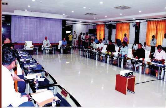
ତା ୨୭.୯.୨୨ରେ ନୀଳାଦ୍ରି ଉଚ୍ଚନିବାସ ଠାରେ ଗଜପତି ମହାରାଜା ଶ୍ରୀଦିବ୍ୟସିଂହ ଦେବଙ୍କ ଅଧିକ୍ଷତାରେ ଆହୂତ 'ଶ୍ରୀମନ୍ଦିର ପରିଚଳନା କମିଟି' ବୈଠକ