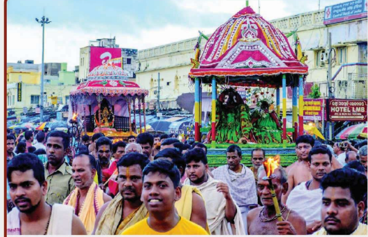
ତା ୫.୧୦.୨୨ରେ ଜଗନ୍ନାଥ ବଲ୍ଲଭ ସମ୍ମୁଖରେ ଦଶହରା ନୀତି ସମ୍ପନ୍ନ ପାଇଁ ବିମାନରେ ଦୁର୍ଗାମାଧବ, ରାମକୃଷ୍ଣ ଓ ମଦନମୋହନ ବିଜେ କରୁଛନ୍ତି ।