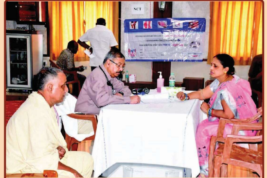
ତା ୩୦.୯.୨୨ରେ ନୀଳାଦ୍ରି ଭଞ୍ଜନିବାସ ଠାରେ ଶ୍ରୀମନ୍ଦିର ପ୍ରଶାସନ ତରଫରୁ ଆୟୋଜିତ ଦ୍ଵିଦିନୀ ଶିବିର ।

● ମହାସଚିବ, ଶ୍ରୀଜଗନ୍ନାଥ ଚେତନା ଗବେଷଣା ପ୍ରତିଷ୍ଠାନ, ପୁରୀ