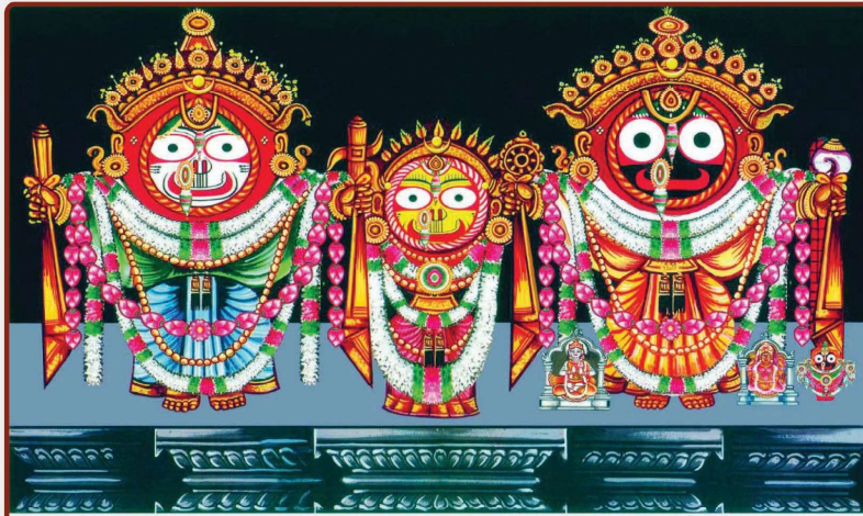
ତା ୮.୧୧.୨୨ରେ ରାଜାଧିରାଜ ବେଶ