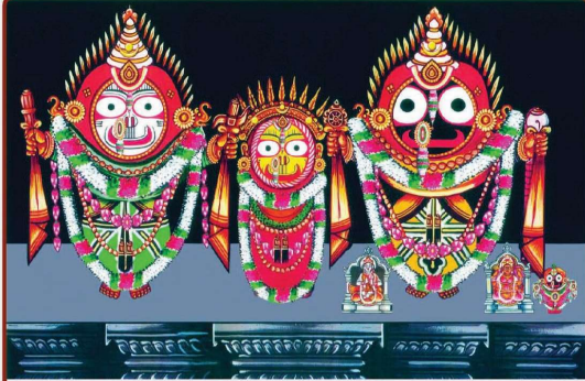
ତା ୪.୧୧.୨୨ରେ ଠିଆକିଆ ବା ଲକ୍ଷ୍ମୀନାରାୟଣ ବେଶ