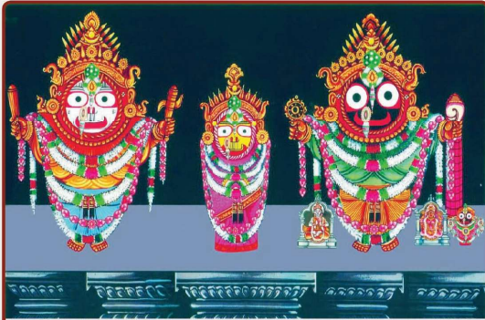
ତା ୬.୧୧.୨୨ରେ ତାଳିକିଆ ବା ତିବିକୁମ ବେଶ