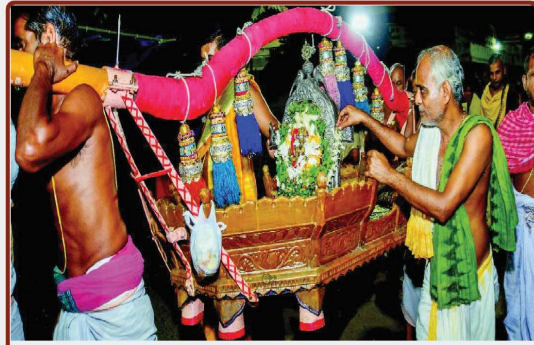
ତା ୨୫.୧୦.୨୨ରେ ଅମାବାସ୍ୟା ନାରାୟଣଙ୍କ ସାଗର ବିଜେ