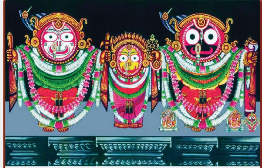
ତା ୫.୧୧.୨୨ରେ ବାଙ୍କଚୂଡ଼ ବା ବାମନ ବେଶ