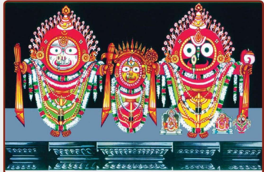
ତା ୭.୧୧.୨୨ରେ ଲକ୍ଷ୍ମୀନୃସିଂହ ବେଶ