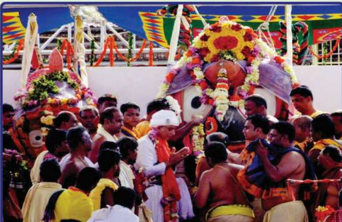
ତା. ୧୭.୦୭.୧୯ରେ ସ୍ନାନ ପୂର୍ଣ୍ଣିମା ଅବସରରେ ସ୍ନାନମଣ୍ଡପରେ ଗଜପତି ମହାରାଜା ଶ୍ରୀ ଦିବ୍ୟସିଂହ ଦେବ ଶ୍ରୀବିଗ୍ରହମାନଙ୍କୁ ପୁଷ୍ପାଞ୍ଜଳି ପ୍ରଦାନ କରୁଛନ୍ତି