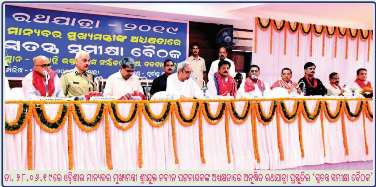
ତା. ୨୮.୦୭.୧୯ରେ ଓଡ଼ିଶାର ମାନ୍ୟବର ମୁଖ୍ୟମନ୍ତ୍ରୀ ଶ୍ରୀଯୁକ୍ତ ନବୀନ ପଟ୍ଟନାୟକଙ୍କ ଅଧିକାରରେ ଅନୁଷ୍ଠିତ ରଥଯାତ୍ରା ପ୍ରସ୍ତୁତିର 'ସ୍ୱତନ୍ତ୍ର ସମାକ୍ଷା ବୈଠକ'