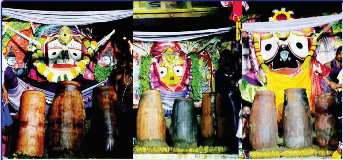
ତା. ୧୪.୦୭.୧୯ରେ ରଥ ଉପରେ ଶ୍ରୀବିଗ୍ରହମାନଙ୍କ ଅଧରପଣା ନୀତି ସମ୍ପନ୍ନ କରାଯାଇଛି