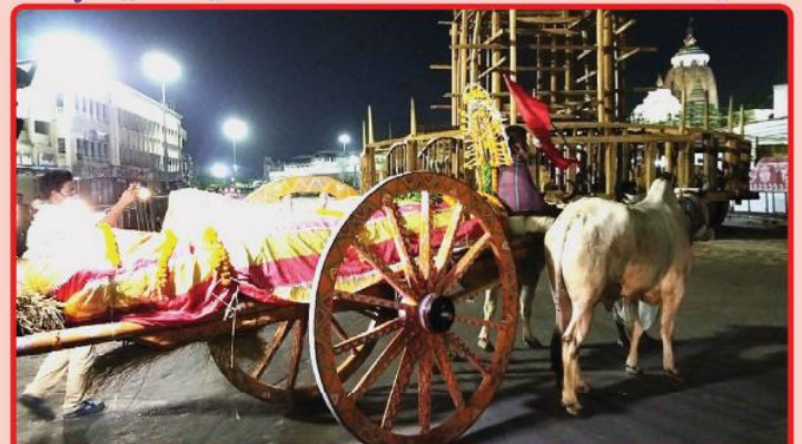
ତା. ୨୧.୬.୨୧ରେ ମହାପ୍ରଭୁଙ୍କ ସେନାପଟା ଓ ବାହୁଡ଼ ଲାଗି ନିମନ୍ତେ ସାକ୍ଷୀଗୋପାଳ ବକୁଳବନ୍ଦରୁ ବଉଳକାଠ ଆସି ଶ୍ରୀକ୍ଷେତ୍ରରେ ପହଞ୍ଚିଲା ।