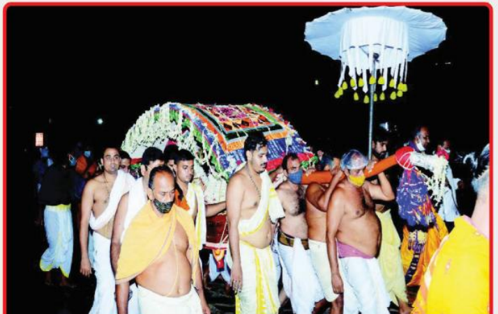
ତା. ୨୨.୬.୨୧ରେ ଚମ୍ପକ ଦ୍ୱାଦଶୀ ପରିପ୍ରେକ୍ଷାରେ ମହାପ୍ରଭୁଙ୍କ ବିବାହ ପରେ ସେବକମାନେ ଦେବଦମ୍ପତିଙ୍କୁ ଶ୍ରୀନଅରକୁ 'ଗୁଆଳି ଯାତ୍ରା'ରେ ନେଉଛନ୍ତି ।