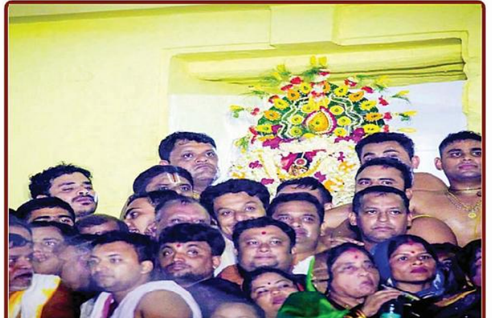
ତା ୧.୭.୨୩ ରେ ନୀଳାଦ୍ରି ବିଜେ ଅବସରରେ ଭେଟ ମଣ୍ଡପରେ ବିରାଜିତା ମା' ମହାଲକ୍ଷ୍ମୀ ଠାକୁରାଣୀ