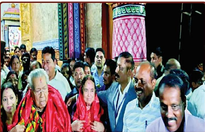
ତା ୯.୭.୨୩ ରେ ଛତିଶଗଡ଼ର ମହାମହିମ ରାଜ୍ୟପାଳ ଶ୍ରୀଯୁକ୍ତ ବିଶ୍ୱ ଭୂଷଣ ହରିଚନ୍ଦନ ସସ୍ତ୍ରୀଙ୍କ ଶ୍ରୀମନ୍ଦିରରୁ ଶ୍ରୀବିଗ୍ରହମାନଙ୍କ ଦର୍ଶନ ସାରି ଫେରୁଅଛନ୍ତି