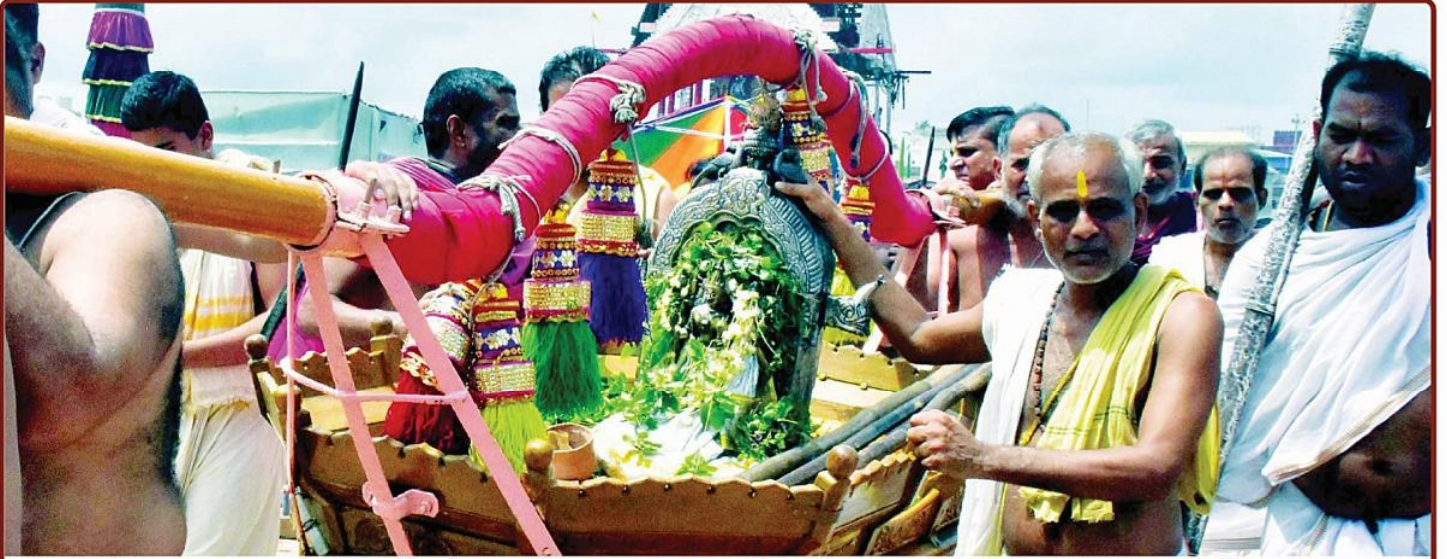
ତା ୧୭.୭.୨୩ ରେ ଚିତାଲାଗି ଅମାବାସ୍ୟା ପରିପ୍ରେକ୍ଷାରେ ଶ୍ରୀନାରାୟଣଙ୍କ ସାଗର ବିଜେ