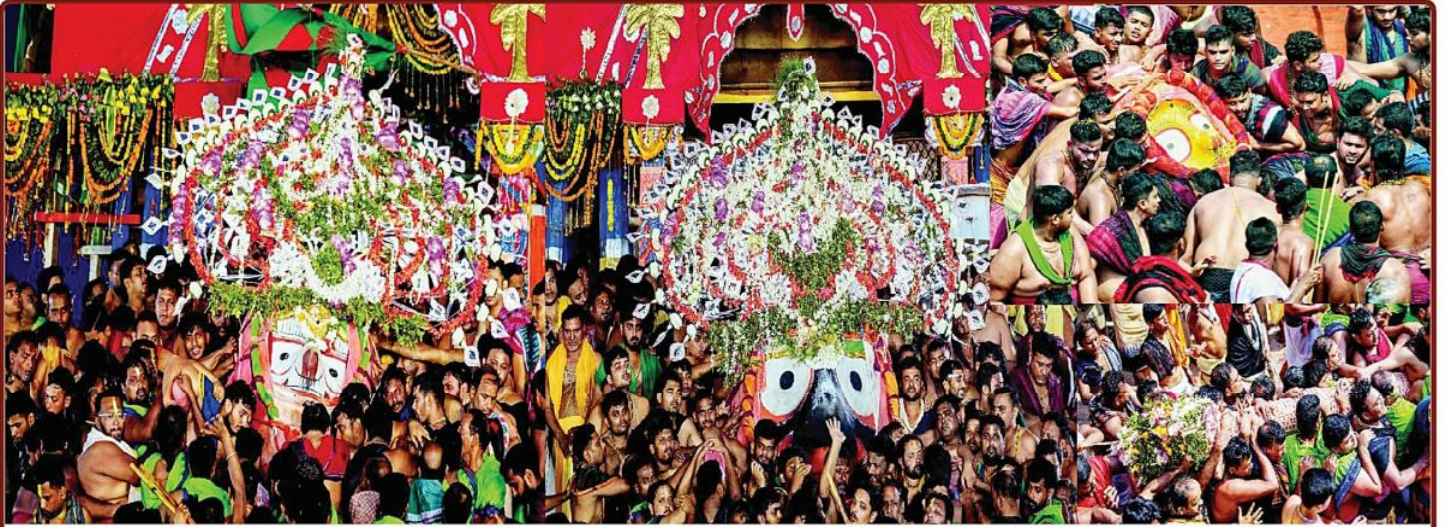
ତା ୧.୭.୨୩ ରେ ଶ୍ରୀବିଗ୍ରହମାନଙ୍କ ନୀଳାଦ୍ରି ବିଜେ