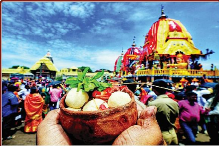
ତା ୧.୭.୨୩ ରେ ନୀଳାଦ୍ରି ବିଜେ ପରିପ୍ରେକ୍ଷାରେ ରଥ ଉପରେ ବିରାଜିତ ଶ୍ରୀବିଗ୍ରହମାନଙ୍କୁ 'ରସଗୋଲା' ଭୋଗ କରାଯାଉଅଛି