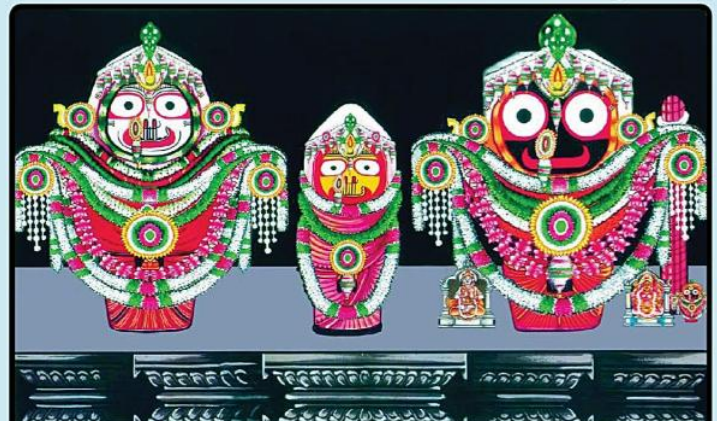
ଶ୍ରୀମନ୍ଦିରରେ ଶ୍ରୀବିଗ୍ରହମାନଙ୍କ ଦୈନନ୍ଦିନ ଅନୁଷ୍ଠିତ 'ବଡ଼ସିଂହାର' ବେଶ

ତା ୩୦.୭.୨୩ ରିଖ ରବିବାର ଆଷାଢ଼ ଶୁକ୍ଳ ଦ୍ଵାଦଶୀ ଦିନ ଶ୍ରୀମନ୍ଦିରରେ ଶ୍ରୀଗରୁଡ଼ ଶୟନ ନୀତି ଅନୁଷ୍ଠିତ ହୋଇଥିଲା । ଶ୍ରୀଗୁରୁଡ଼ଙ୍କର ମହାସ୍ନାନ ସାମଗ୍ରୀ ପର୍ବଯାତ୍ରା ଯୋଗାଣିଆ ଯୋଗାଇଥିଲେ । ନିମ୍ନଲିଖିତ ସେବକମାନଙ୍କ ଦ୍ଵାରା ଏହି ନୀତି କାର୍ଯ୍ୟ ସମ୍ପନ୍ନ ହୋଇଥିଲା ଯଥା- ପର୍ବଯାତ୍ରା ଯୋଗାଣିଆ, ପୂଜାପଣ୍ଡା, ସୁଦୁସୁଆର । ଏହି ଦିନ ସନ୍ଧ୍ୟା ଧୂପ ସରିବା ପରେ ଗରୁଡ଼ଙ୍କ ଠାରେ ପର୍ବଯାତ୍ରା ଯୋଗାଣିଆ ଦେଇଥିବା ମହାସ୍ନାନ ସାମଗ୍ରୀ ସୁଦୁସୁଆର ପୂଜାଠା କରିବା ପରେ ଜଣେ ପୂଜାପଣ୍ଡା ମହାସ୍ନାନ ବଢ଼ାଇଥିଲେ । ତାହାପରେ ଶୀତଳ ଭୋଗ କରି ଆଳତି ବନ୍ଦାପନା କରାଯାଇଥିଲା । ●