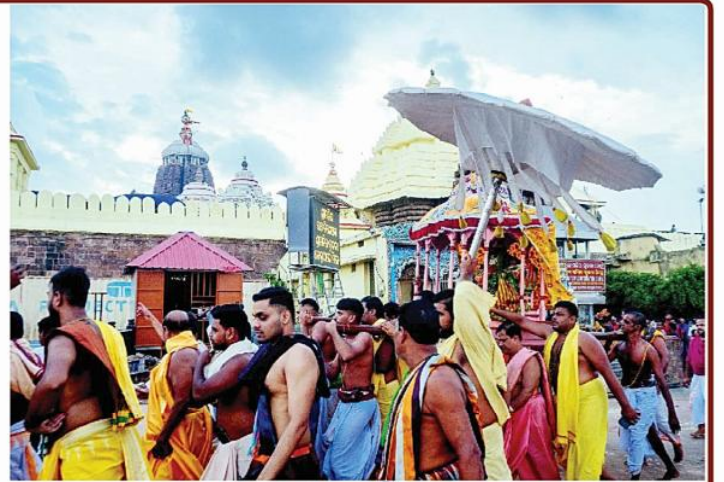
ତା ୧୩.୭.୨୩ ରେ ଶ୍ରୀମନ୍ଦିରରେ କାମଦା ବା ଚକ୍ରାବୁଲା ଏକାଦଶୀ ପରିପ୍ରେକ୍ଷାରେ ଶ୍ରୀଚକ୍ରନାରାୟଣ ଶ୍ରୀମନ୍ଦିରରୁ ବାହାରି ଚାରି ଆଶ୍ରମକୁ ବିଜେ କରୁଅଛନ୍ତି