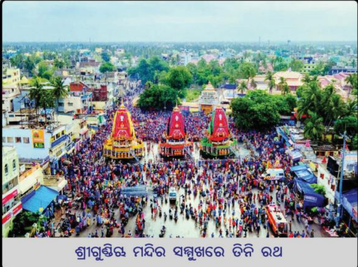
ଶ୍ରୀଗୁଣ୍ଡିଚା ମନ୍ଦିର ସମ୍ମୁଖରେ ତିନି ରଥ

● ମହାସଚିବ, ଶ୍ରୀଜଗନ୍ନାଥ ଚେତନା ଗବେଷଣା ପ୍ରତିଷ୍ଠାନ, ପୁରୀ