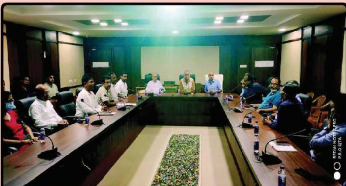
ତା ୧୭.୭.୨୨ରେ ଶ୍ରୀମନ୍ଦିର ମୁଖ୍ୟ କାର୍ଯ୍ୟାଳୟ ଠାରେ ଗଜପତି ମହାରାଜା ଶ୍ରୀ ଦିବ୍ୟସିଂହ ଦେବଙ୍କ ଅଧକ୍ଷତାରେ ଏବଂ ଶ୍ରୀମନ୍ଦିର ମୁଖ୍ୟ ପ୍ରଶାସକ ଶ୍ରୀଯୁକ୍ତ ବୀର ବିକ୍ରମ ଯାଦବଙ୍କ ଉପସ୍ଥିତିରେ ଆହୂତ 'ଶ୍ରୀମନ୍ଦିର ସଂସ୍କୃତି ପରାମର୍ଶଦାତା କମିଟି' ବୈଠକ ।