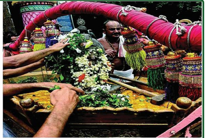
ତା ୧୭.୮.୨୩ ରେ ଅମାବାସ୍ୟା ଅବସରରେ ଶ୍ରୀନାରାୟଣଙ୍କ ସାଗର ବିଜେ