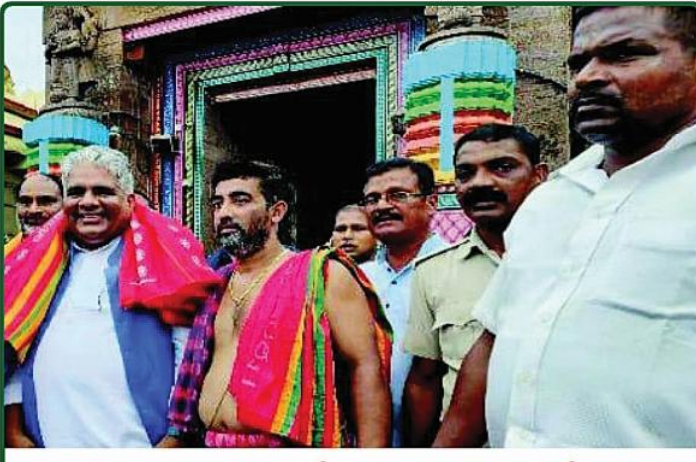
ତା ୧୨.୮.୨୩ ରେ କେନ୍ଦ୍ର, ନିୟୋଜନ, ଜଙ୍ଗଲ ଓ ପରିବେଶ ମନ୍ତ୍ରୀ ଶ୍ରୀମୁଖ ଭୂପେନ୍ଦ୍ର ଯାଦବ ଶ୍ରୀମନ୍ଦିରରେ ଶ୍ରୀବିଗ୍ରହମାନଙ୍କ ଦର୍ଶନ ସାରି ଫେରୁଅଛନ୍ତି