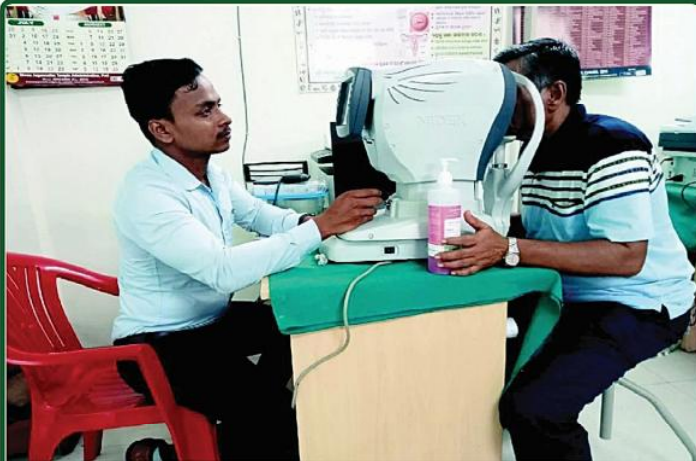
ତା ୮.୮.୨୩ ରେ ନୀଳାଦ୍ରି ଭିକ୍ଷା ନିବାସ ଠାରେ ଶ୍ରୀମନ୍ଦିର ପ୍ରଶାସନ ତରଫରୁ ଆୟୋଜିତ ନିଃଶୁଳ୍କ 'ମଧୁମେୟ ଓ ଚୂଷ୍ମ ପରୀକ୍ଷା ଏବଂ ପରାମର୍ଶ' ଶିବିର