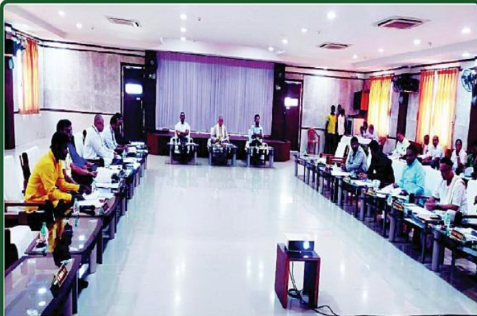
ତା ୪.୮.୨୩ ରେ ନୀଳାଦ୍ରି ଭିକ୍ଷା ନିବାସ ଠାରେ ଗଜପତି ମହାରାଜା ଶ୍ରୀ ଶ୍ରୀ ଦିବ୍ୟସିଂହ ଦେବଙ୍କ ଅଧକ୍ଷତାରେ ଆହୂତ 'ଶ୍ରୀମନ୍ଦିର ପରିଚ୍ଛେଦନା କମିଟି' ବୈଠକ