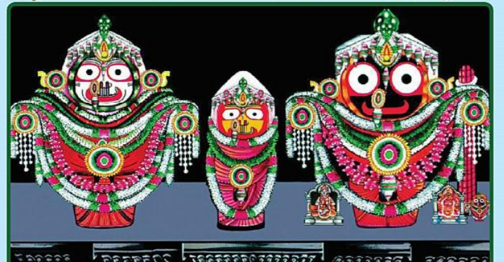
ଶ୍ରୀବିଗ୍ରହମାନଙ୍କ ଦୈନନ୍ଦିନ ଅନୁଷ୍ଠିତ ‘ବଡ଼ସିଂହାର’ ବେଶ

● (ପୂର୍ବତନ କାର୍ଯ୍ୟକର୍ତ୍ତା, ପ୍ରସାର ଭାରତୀ), ମଂଗଳାଘାଟ ରୋଡ଼, ପୁରୀ-୧