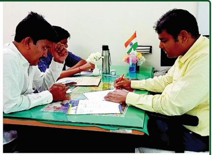
ତା ୧୪.୮.୨୩ ରେ ନୀଳାଦ୍ରି ଉଚ୍ଚନିବାସ ଠାରେ ଶ୍ରୀମନ୍ଦିର ପ୍ରଶାସନ ତରଫରୁ ଆୟୋଜିତ ନିଃଶୁଳ୍କ 'ଲିଭର ଏବଂ ଗ୍ୟାସ' ଜନିତ ରୋଗର ପରୀକ୍ଷା ଏବଂ ପରାମର୍ଶ ଶିବିର