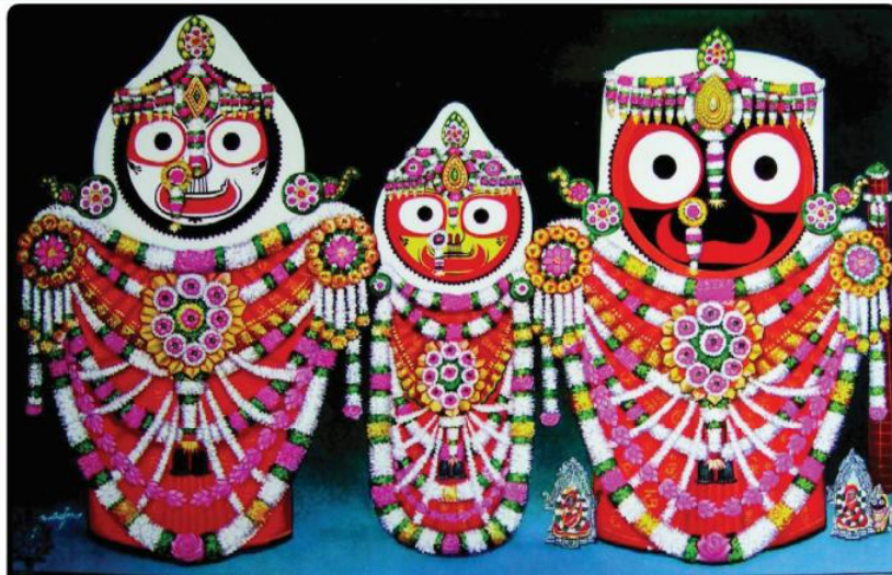
ଶ୍ରୀଚତୁର୍ଦ୍ଧା ବିଗ୍ରହଙ୍କ ଦୈନନ୍ଦିନ ବଡ଼ସିଂହାର ବେଶ