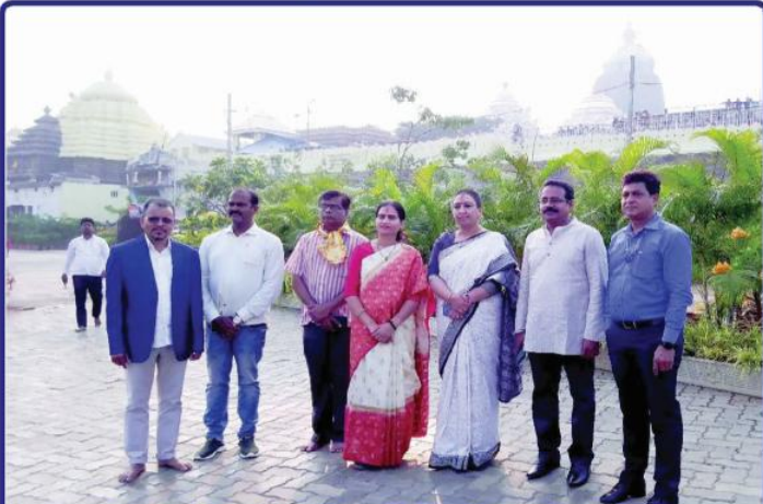
ତା ୩.୧୨.୨୨ରେ କେନ୍ଦ୍ର ସ୍ୱାସ୍ଥ୍ୟ ରାଷ୍ଟ୍ରମନ୍ତ୍ରୀ ଶ୍ରୀମତୀ ଭାରତୀ ପ୍ରବାଣ ପାଞ୍ଜର ଶ୍ରୀମନ୍ଦିରରୁ ଶ୍ରୀଚତୁର୍ଦ୍ଧା ବିଗ୍ରହଙ୍କ ଦର୍ଶନ ସାରି ଫେରୁଅଛନ୍ତି