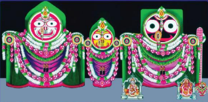
ତା. ୨୯.୧୧.୨୨ରେ ପ୍ରାବରଣ ବା ଓଡ଼ିଶା ଷଷ୍ଠୀ ପରିପ୍ରେକ୍ଷୀରେ ଶ୍ରୀମନ୍ଦିରରେ ବଡ଼ୁର୍ଦ୍ଧା ବିଗ୍ରହଙ୍କ 'ଘୋଡ଼ୁଲାଗି' ବେଶ