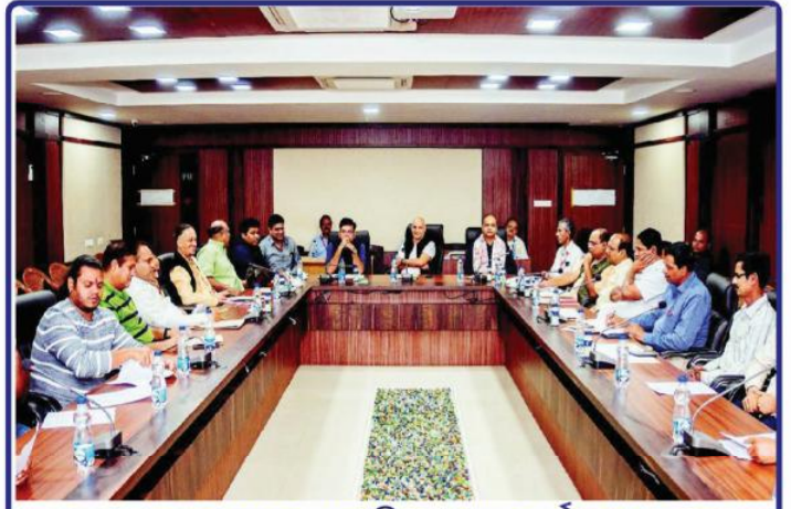
ତା ୭.୧୨.୨୨ରେ ଶ୍ରୀମନ୍ଦିର ମୁଖ୍ୟ କାର୍ଯ୍ୟାଳୟ ଠାରେ ଶ୍ରୀବିଗ୍ରହମାନଙ୍କ ପହିଲି ଭୋଗ, ଦେବାଭିଷେକ ପୂର୍ଣ୍ଣିମା ଇତ୍ୟାଦି ପରିପ୍ରେକ୍ଷାରେ ମୁଖ୍ୟ ପ୍ରଶାସକ ଶ୍ରୀଯୁକ୍ତ ବୀର ବିକ୍ରମ ଯାଦବଙ୍କ ଅଧକ୍ଷତାରେ ଆହୂତ 'ଛତିଶା ନିଯୋଗ' ବୈଠକ