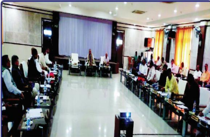
ତା ୧୫.୧୨.୨୨ରେ ନୀଳାଦ୍ରି ଉଚ୍ଚନିବାସ ଠାରେ ଗଜପତି ମହାରାଜା ଶ୍ରୀଶ୍ରୀ ଦିବ୍ୟସିଂହ ଦେବଙ୍କ ଅଧକ୍ଷତାରେ ଆହୂତ 'ଶ୍ରୀମନ୍ଦିର ପରିଚାଳନା କମିଟି' ବୈଠକ