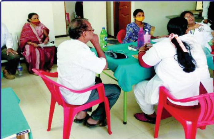
ତା ୨୯.୧୧.୨୨ରେ ନୀଳାଦ୍ରି ଭକ୍ତନିବାସ ଠାରେ ଶ୍ରୀମନ୍ଦିର ପ୍ରଶାସନ ତରଫରୁ ଆୟୋଜିତ ନିଃଶୁଳ୍କ 'ଚକ୍ଷୁ ପରୀକ୍ଷା' ଶିବିର