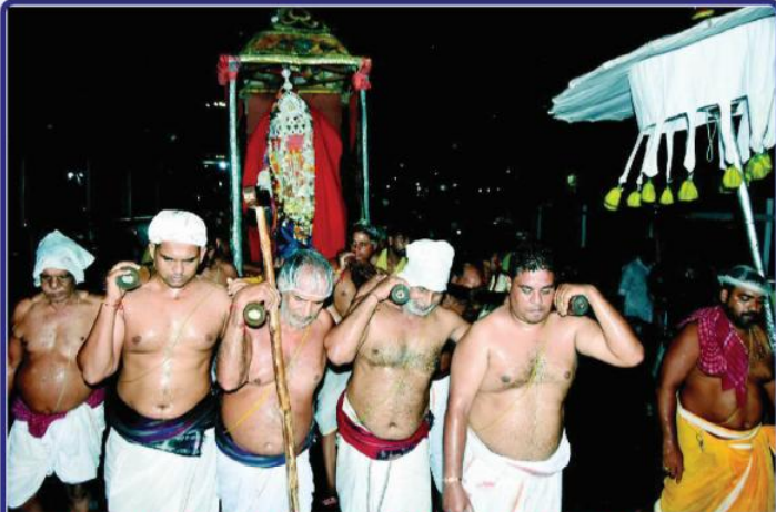
ତା. ୧୨.୮.୨୨ରେ ଶ୍ରୀମନ୍ଦିରରେ ଶ୍ରୀବଳଭଦ୍ରଙ୍କ ଜନ୍ମ ଓ ରାକ୍ଷୀ ଲାଗି ଅବସରରେ ଶ୍ରୀସୁଦର୍ଶନଙ୍କ ମାର୍କଣ୍ଡେୟ ପୁଷ୍କରିଣୀକୁ ବିଜେ ।