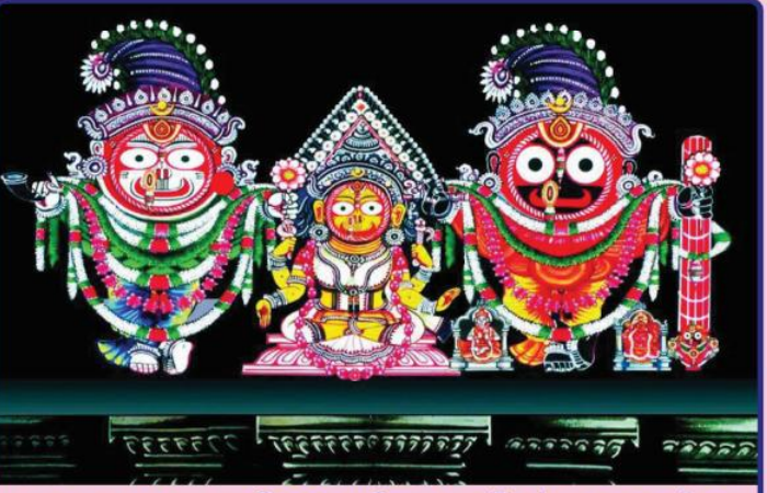
ତା. ୨୫.୮.୨୨ରେ ଶ୍ରୀମନ୍ଦିରରେ ଶ୍ରୀବିଗ୍ରହଙ୍କ ଅନୁଷ୍ଠିତ 'କୃଷ୍ଣ ବଳରାମ' ବେଶ