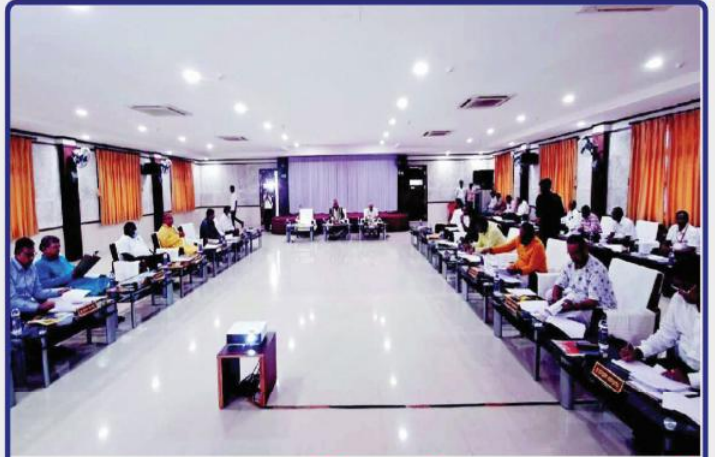
ତା. ୨୮.୨୨ରେ ନୀଳାଦ୍ରି ଭକ୍ତ ନିବାସ ଠାରେ ଗଜପତି ମହାରାଜା ଶ୍ରୀ ଦିବ୍ୟସିଂହ ଦେବଙ୍କ ଅଧ୍ୟକ୍ଷତାରେ ଆହୂତ 'ଶ୍ରୀମନ୍ଦିର ପରିଚ୍ଛଳନା କମିଟି' ବୈଠକ