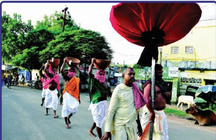
ତା. ୨୬.୮.୨୨ରେ ସପ୍ତପୁରୀ ଅମାବାସ୍ୟା ପରିପ୍ରେକ୍ଷୀରେ ଅଠରନଳାସ୍ଥିତ ମା' ଅଳାମତଣ୍ଡୀ ମନ୍ଦିରରୁ ପାରମ୍ପରିକ ଭାବେ ଶ୍ରୀମନ୍ଦିରକୁ 'ସାତପୁରୀ ତାଡ଼' ବିଜେ କରାଯାଇଛି ।