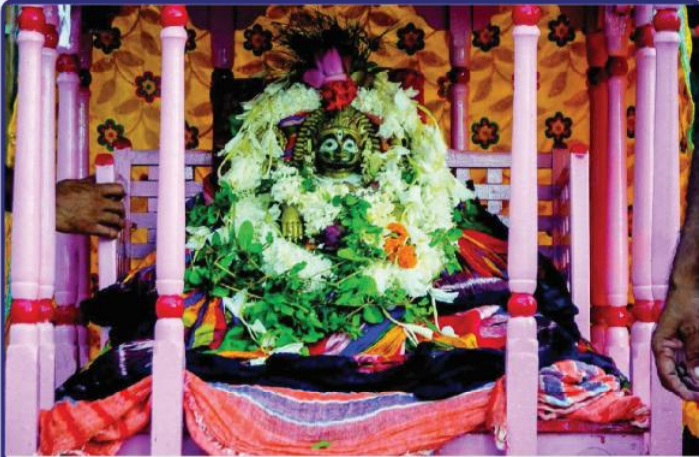
ତା. ୨୮.୨୨ରେ ବାଡ଼ି ନୃସିଂହଙ୍କ ଉରି ଆଶ୍ରମ ବିଜେ