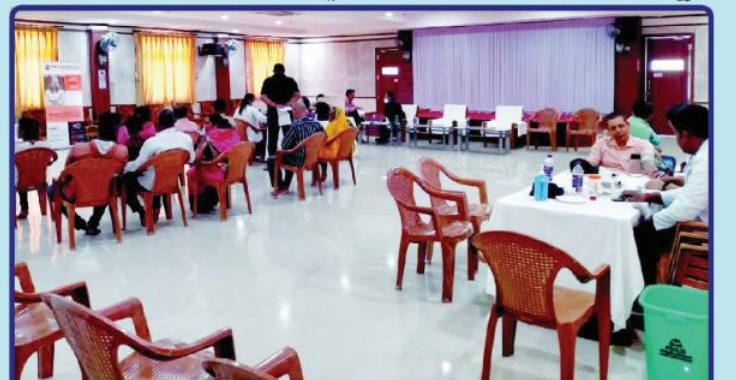
ଡା. ୩୦.୮.୨୨ରେ ନୀଳାଦ୍ରି ଉଚ୍ଚ ନିବାସ ଠାରେ ଶ୍ରୀମନ୍ଦିର ପ୍ରଶାସନ ଏବଂ ଏ.ଏସ୍.ଜି. ହସ୍ପିଟାଲ, ଭୁବନେଶ୍ୱରଙ୍କ ମିଳିତ ଆନୁକୂଲ୍ୟରେ ଆୟୋଜିତ 'ନିଃଶୁକ୍ଳ ବୃକ୍ଷ ବିକିଷା' ଶିବିର

● ମହାସଚିବ, ଶ୍ରୀଜଗନ୍ନାଥ ଚେତନା ଗବେଷଣା ପ୍ରତିଷ୍ଠାନ, ପୁରୀ