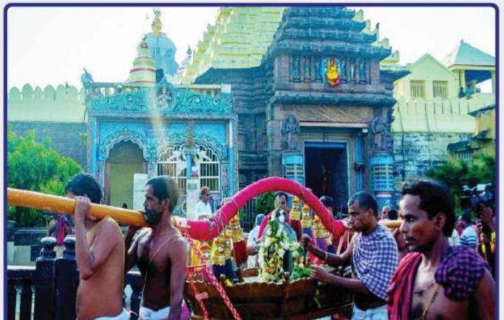
ତା. ୨୭.୮.୨୨ରେ ସପ୍ତପୁରୀ ଅମାବାସ୍ୟା ପରିପ୍ରେକ୍ଷୀରେ ଶ୍ରୀନାରାୟଣଙ୍କ ସାଗର ବିଜେ ।